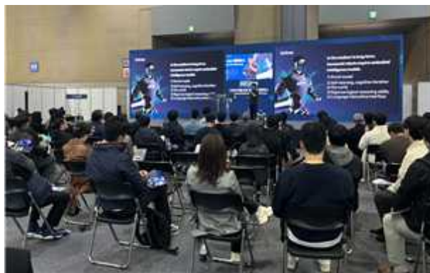
< 국제로봇비즈니스컨퍼런스 >