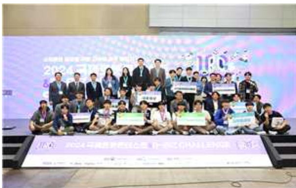
< 국제로봇콘테스트 & R-BIZ Challenge >