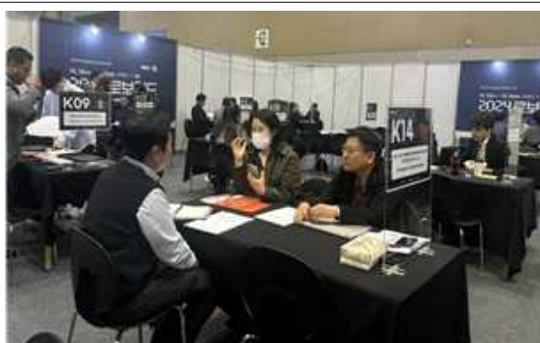
< 해외바이어 부스상담 >