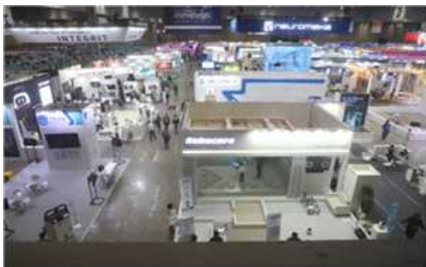
< 전시장 부스 전경 >