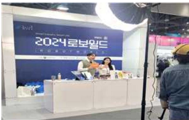
< 전시회 현장 라이브커머스 >