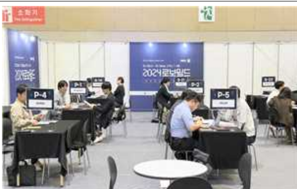
< 국내바이어 구매상담회 >