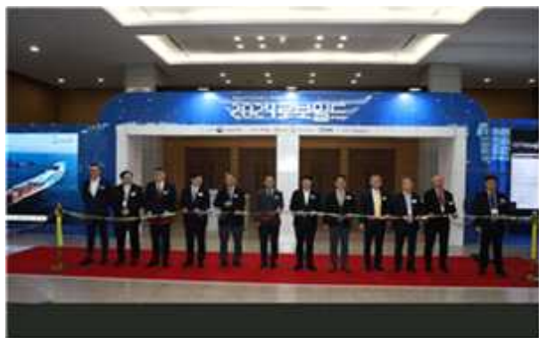
< 전시회 개막식 >