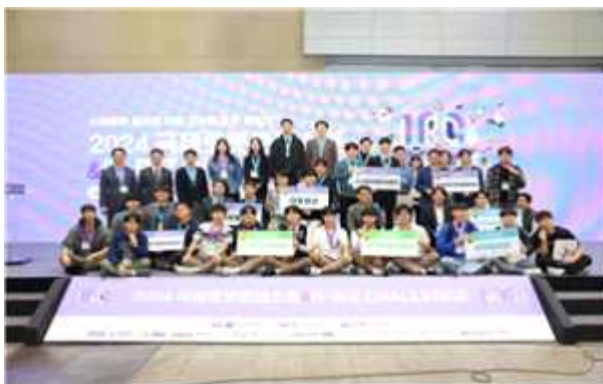
< 국제로봇콘테스트 & R-BIZ Challenge >