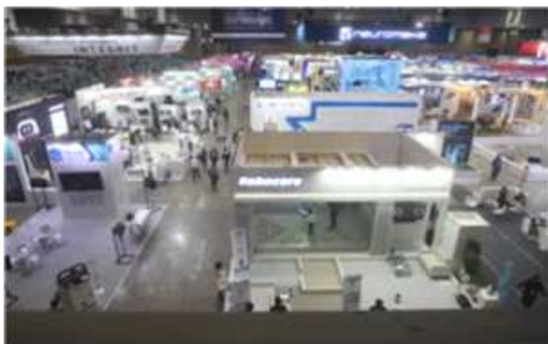
< 전시장 부스 전경 >