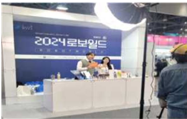
< 전시회 현장 라이브커머스 >